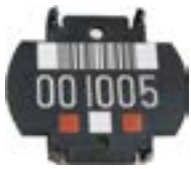
Trommellabel bis Okt. 2010

Die Labelnummer finden Sie auch angedruckt in unseren Lieferscheinen.