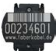
Trommellabel seit Okt. 2010