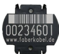
Trommellabel seit Okt. 2010