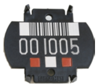
Trommellabel bis Okt. 2010

Die Labelnummer finden Sie auch angedruckt in unseren Lieferscheinen.